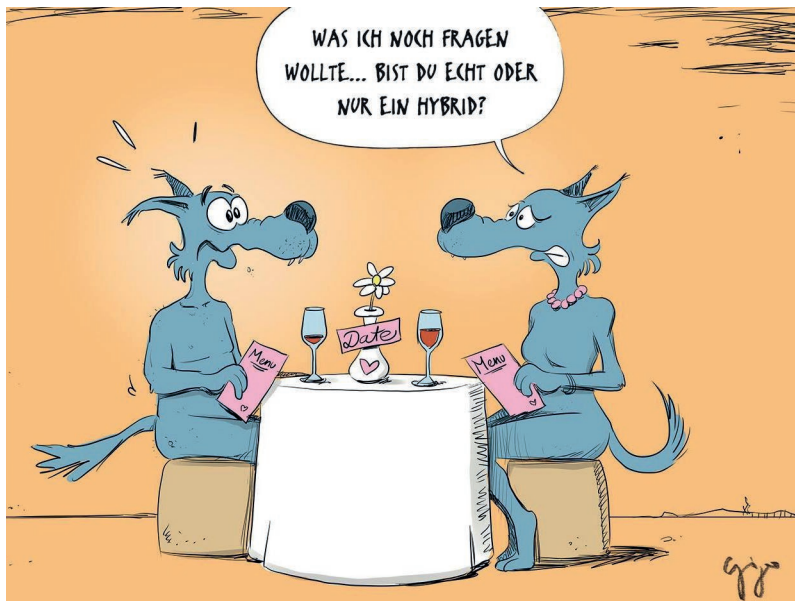
Cartoon: Gabriel Giger

mentan eine Analyse sämtlicher Wölfe durch, die in den letzten 20 Jahren in der Schweiz identifiziert wurden. Wissenschaftler haben gerade gezeigt, dass es in Eurasien sehr deutliche Spuren von gemischten Abstammungen zwischen Wölfen und Hunden gibt und dass es sich um ein wiederkehrendes, aber uraltes Phänomen handelt. Trotzdem bilden Wölfe und Hunde zwei gut differenzierte genetische Gruppen, was darauf hindeutet, dass diese Introgressionen des Wolfsgenoms durch das Hundegenom heute ein eher marginales Phänomen darstellen.