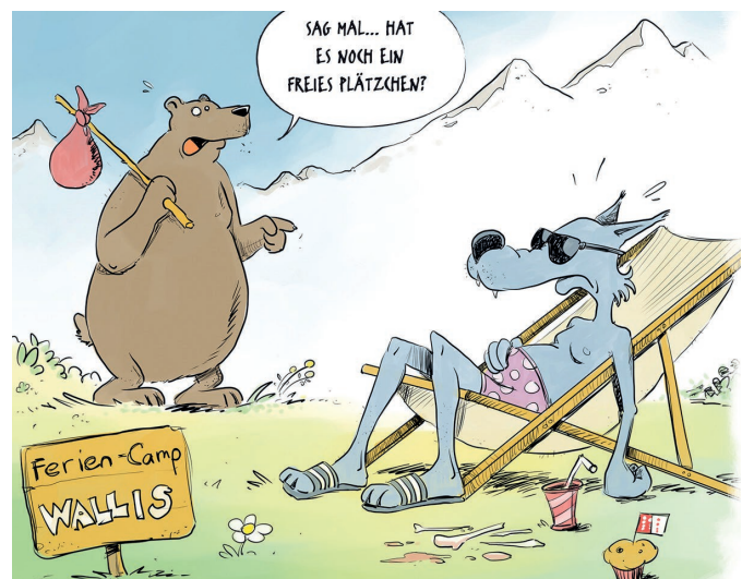
Cartoon: Gabriel Giger