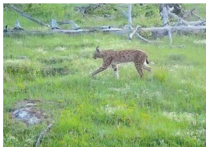
Der Luchs unterwegs im Oberwallis.

Als Fazit steht im Bericht: Einerseits wisse man nach 50 Jahren Erfahrung, dass der Luchs das Reh nicht ausrotte. Andererseits hätten mehrere lokale oder regionale Begebenheiten gezeigt, dass der Einfluss des Luchses auf seine wichtigsten Beutetiere Reh und Gämse bedeutend sein könne. Nichtsdestotrotz müsse dem schwankenden Einfluss des Luchses auf lokale Reh- und Gämsepopulation im Wildtiermanagement Rechnung getragen werden.