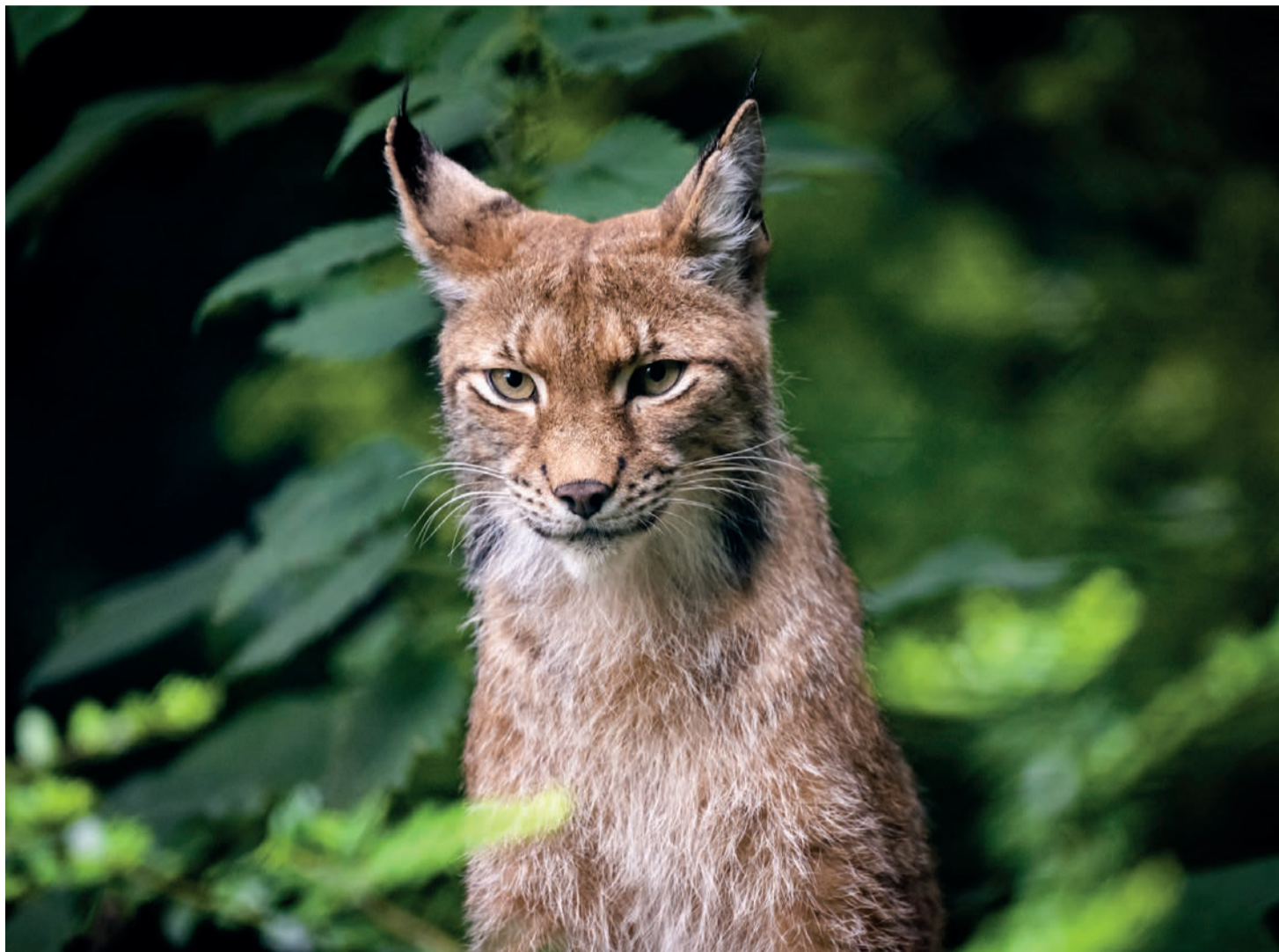
Der Luchs ist selten bei Tageslicht zu sehen.

Die Luchswiederansiedlung in der Schweiz vor einem halben Jahrhundert sei eine Nacht- und Nebel-Aktion mit völlig unzureichender Koordination und Kommunikation gewesen, steht im Bericht der KORA. Es habe keinen übergeordneten Plan für die Wiederansiedlung und kein Monitoring der freigelassenen Tiere, ihres Schicksals und ihrer Wirkung gegeben. Angesichts