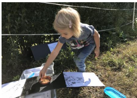
Fig. 2 : Personne n'est trop petit pour participer au contrôle des traces ! Ici, c'est un hérisson qui a laissé ses empreintes.