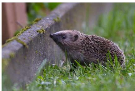
Fig. 1 : Hérisson.

Les photos sont à télécharger sur : https://valais.nosvoissauvages.ch/presse (en double cliquant dessus).